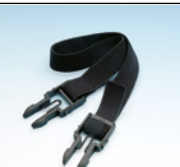
1x archetto a clip tipo 58.01.01

Il copricapo a clip garantisce un fissaggio sicuro degli occhiali da nistagmo davanti agli occhi del paziente.