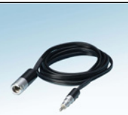
Cavo a baionetta DEHAG tipo 7.03.05

Il copricapo a clip garantisce un fissaggio sicuro degli occhiali da nistagmo davanti agli occhi del paziente.