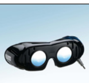
1x Occhiali da nistagmo tipo 703